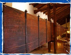
MOLINO DE LAS PILAS. TEBÁ